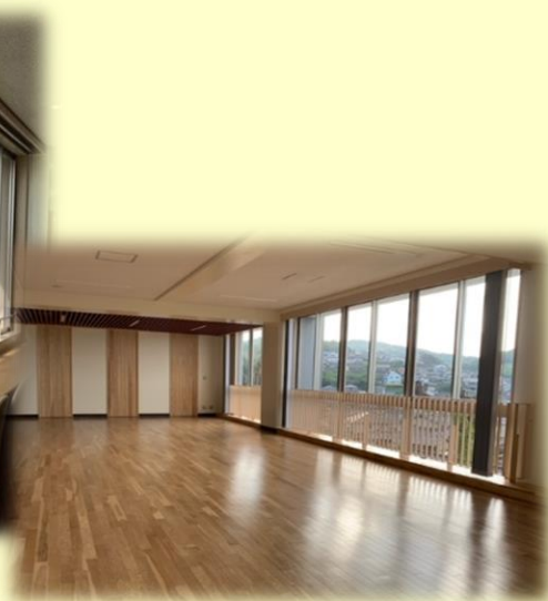
広々としたコモンホール