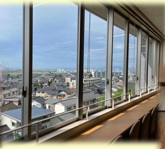
図書館から見える響灘