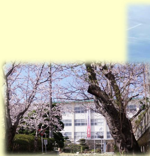
入学生を迎える満開の若高坂の桜